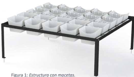
Figura 1: Estructura con macetas.